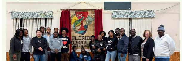
Retiro de Clérigos y Liderazgo Haitiano 2025

Fortalecer el ministerio regional asegura que cada congregación tenga el apoyo y los recursos necesarios para crecer, innovar y servir fielmente a sus comunidades.